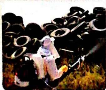
Aplicación con Líquido UBV - BV