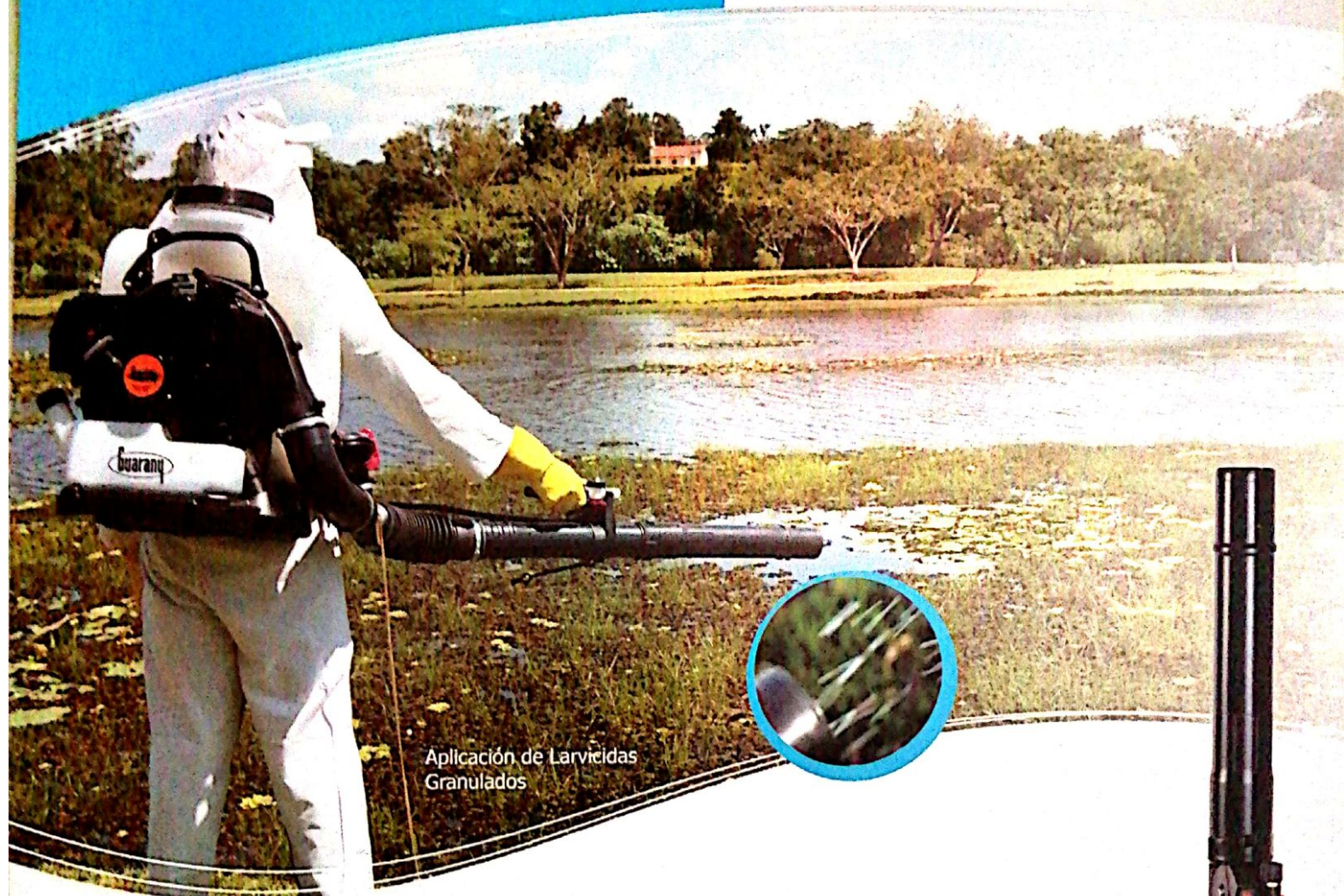
Aplicación de Larvicidas Granulados