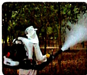
Aplicación con Polvo